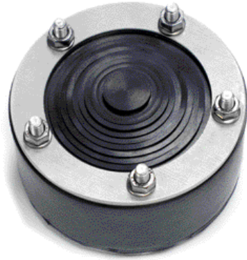
Вариа 1.5 DN 100

Для удаления лишних резиновых пластин достаточно надавить на пластину руками или отверткой и сделать надрез ножом на продавленной части, после чего кольцо легко вытягивается вручную.