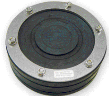
Вариа DN 150