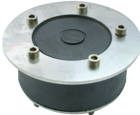
Вариа 1.5 с большим фланцем DN 100